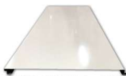
仮囲い鋼板カラーF型