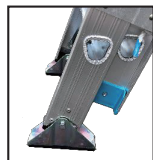
滑り止め 端具ユニット部分 (2連はしご)