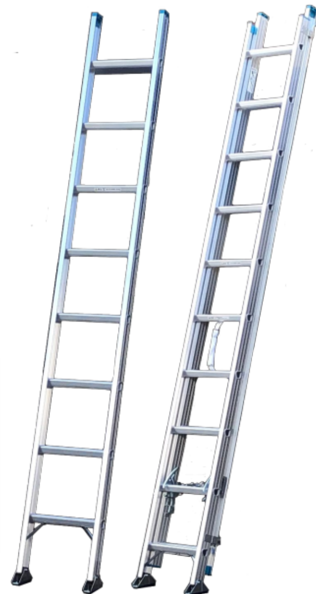
1連はしご 2連はしご